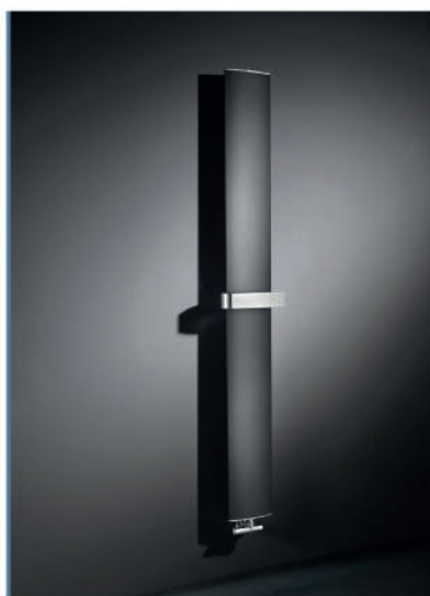
OTHELLO MONO SLIM